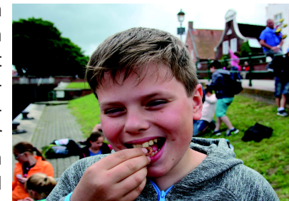
Exkursion nach Greet siel

Als UNESCO-Projektschule widmen wir uns besonders dem Weltkulturerbe vor unserer Haustür: Das Wattenmeer ist von globaler Bedeutung, weshalb wir schon mit unseren Fünftklässlern diesen Natu r a u m erkunden. In Kooperation mit dem Nationalparkhaus Greet siel führen wir in den Fächern Biologie und Erdkunde Projekt tage durch, bei denen die Vielfalt des Wattenmeeres intensiv untersucht wird. Neben der Auseinandersetzung mit naturwissenschaftlichen Fragestellungen zur Ökologie des Nationalparks gehört vor allem der Küstenschutz zu den Themen, die im Rahmen dieser Tage bearbeitet werden – ein in Zeiten des Klimawandels unumgängliches Thema der Gegenwart und der Zukunft der Schülerinnen und Schüler.