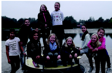
Kennenlernen in Ihlow

Gleich zu Beginn fahren unsere neuen Schüler deshalb an den Einführungstagen nach Ihlow. Dort fördern wir die Klassengemeinschaft und die Sozial- und Methodenkompetenz, um unseren Jüngsten einen erfolgreichen Start am Gymnasium zu ermöglichen.