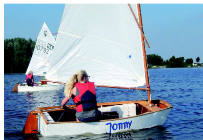
Auf dem Uphuser Meer

Das Max bietet ein verlässliches Ganztagsangebot mit einer Hausaufgabenbetreuung und vielen attraktiven Arbeitsgemeinschaften an: z.B. Segeln, Theater, Mathe, Physik, Informatik, Schach, Fußball, Weltretter, Selbstverteidigung, Volleyball, Theater, Schulsanitätsdienst, Schreibwerkstatt, Plattdeutsch.