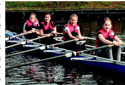
Rudern - ein toller Team sport!

Als Rudergymnasium bietet das Max seinen Schülerinnen und Schülern einen außergewöhnlichen Sportunterricht: Schon in der 6.Klasse geht es in Ruderbooten aufs Wasser! Zudem veranstalten wir alljährlich für die Klassen 5-7 unsere Ruderergometer-ReGaTta und eine Drachenboot-ReGaTta für alle Klassenstufen.