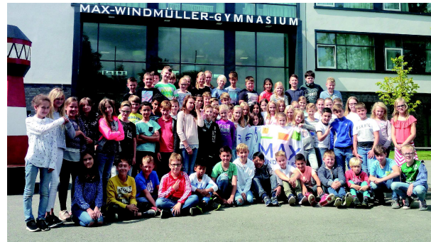
Einschulung der Fünftklässler

Sie möchten mehr erfahren? Informationsnachmittag am 7. Dezember 2017 von 16.30 - 18.30 Uhr Schnupperunterricht am 3. März 2018 von 10.30 - 12.30 Uhr