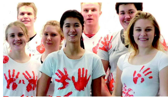
Red Hand Day- gegen den Einsatz von Kindersoldaten!

Zusammenleben lernen in einer pluralistischen Welt in kultureller Vielfalt: Als UNESCO-Projektschule fühlen wir uns besonders diesem übergeordneten Bildungsziel verpflichtet. Die Erziehung zu Menschenrechten, Demokratie und Toleranz ist deshalb fester Bestandteil unserer Schulkultur und Bestandteil unseres Unterrichtes.