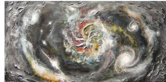
„La création du monde“ von Cedric Sorel

Betrachtungen aus Physik, Philosophie und Theologie